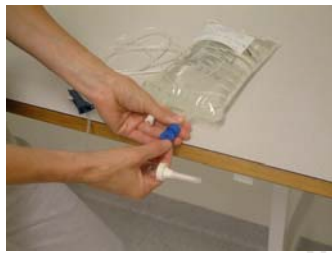
Vrid eller vicka bort proppen till den stora öppningen/den med pil utåt.