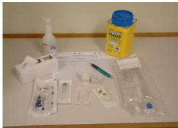
Ordinationshandling, infusion, infusionsaggregat, ev. tillsatser, etikett Spruta, kanyler, trevägskran Sprit, kompresser och avfallsburk