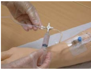
St ng trev gskranen mot droppet och spola igenom pvk'n med 3-5 ml NaCl.