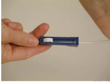
Stäng slangklämman genom att dra det vita hjulet ända ner.