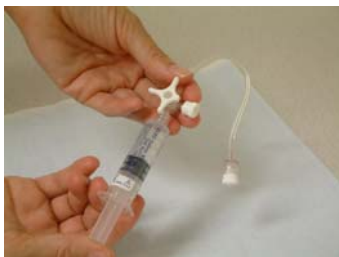
Fyll trevägskranen med NaCl.