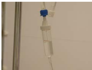
Justera droppakten genom att r kna antal droppar/min i droppkammaren.