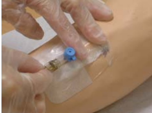
Fixera pvk'n och stäng av k rlet f r att undvika bl dning. Koppla p  infusionsslangen.