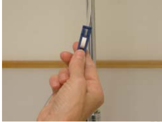
Öppna slangklämman och fyll upp hela slangen. Se till att det inte finns några luftbubblor.