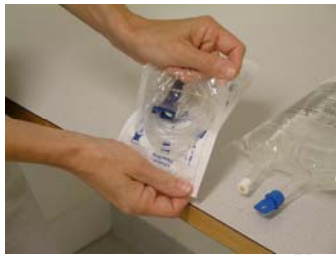
Öppna infusionsaggregatet enl märkning. Om infusionen är i glasflaska – tänk på att ha aggregat med luftning.