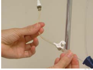
Koppla ihop trevägskranen med infusionen. Stäng mot patienten när du är klar.