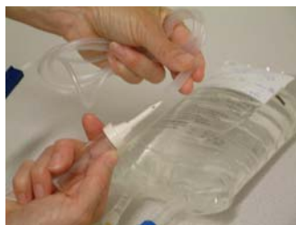
Tag bort skyddet på aggregatets instickstagg.