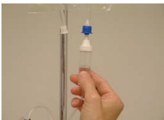
Fyll droppkammaren genom att klämma ihop den och släppa efter. Fyll upp till strecket.