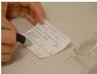
Fyll i etiketten.