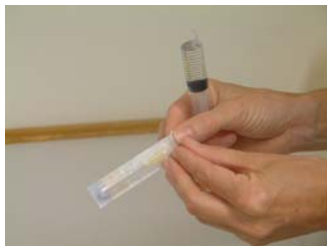
Byt till ny kanyl.