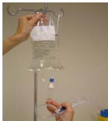
Häng upp päsens.