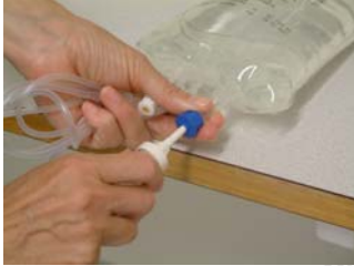
Håll stadigt i infusions slang + päsens hals när du för in aggregatet med en vridande rörelse. Tänk på att arbeta aseptiskt!