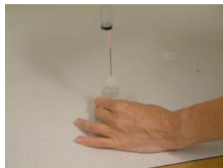
Förbered ev tillsats. Låt ampullen stå stadigt mot underlaget när du perforerar membranet. Anpassa sprustorleken till mängden läkemedel.