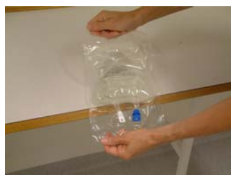
Öppna ytterförpackningen till infusionen.