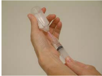
Dra upp ordinerad mängd läkemedel. För att underlätta vid uppdragning av läkemedel ur plastampull, använd handgrepp som på bilden.