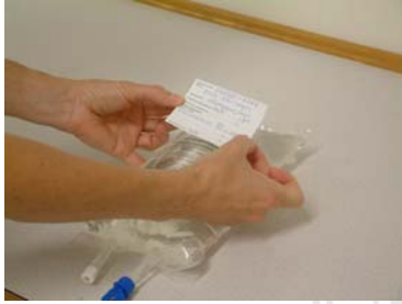
Klistra fast etiketten så att påsens innehållsförteckning inte döljs.