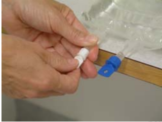
Vrid eller vicka bort förslutningen till den minsta öppningen åt den med pil inåt.