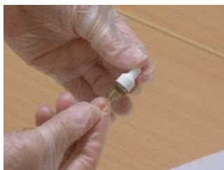
Avlägsna den vita proppen genom att vrida på den.